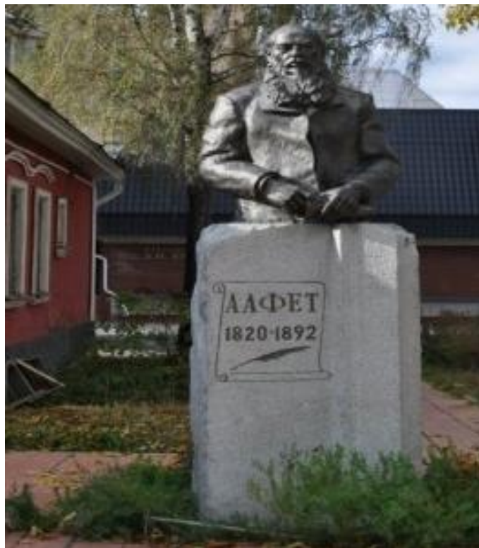
Рис.23. Памятник А. А. Фету в г. Орле.