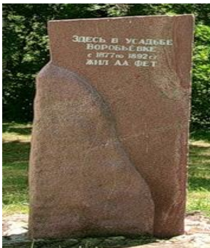
Рис. 25. Памятная стелла в усадьбе Воробьёвке с надписью: «Здесь в усадьбе Воробьёвке с 1877 по 1892 гг. ЖИЛ А.А.ФЕТ».