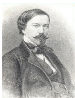
Рис. 6. Иоганн-Петер-Карл-Вильгельм Фёт (1789–1826)

Родители мальчика поженились 18 мая 1818 г. в Дармштадте. У супругов была маленькая дочь Каролина. В отношениях четы Фёт не все было благополучно, так как Иоганн Фёт влез в большие долги, что не могло радовать супругу.