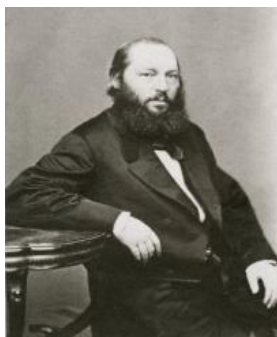
Рис.14. А. Фет – хозяин имения Степановки. Фото 1860-х гг

В следующем году А. А. Фет, выйдя в отставку, так и не добившись дворянства, и купив на средства приданого супруги на своей родине имение Степановку, посвящает себя ведению хозяйства. Прожив здесь 17 лет, он создал прекрасное имение: отделал дом и расширил его пристройками, выкопал пруды и колодцы, насадил аллеи, развёл цветники, открыл больницу для бедных крестьян, запустил проект конного завода, выращивал зерновые культуры (прежде всего, рожь), держал коров, овец, птиц, разводил пчёл и рыбу (рис.14).