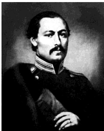
Рис. 10. А.Фет при поступлении на военную службу. Фото начала 1850-х годов

в основном две темы: природу и любовь. Наиболее его популярными стихами считаются: «Я долго стоял неподвижно...», 1843, «Я пришёл к тебе с приветом...», 1843, «Степь вечером», 1854, «Только встречу улыбку твою...», 1873, «Если радуется утро тебя...», 1887.