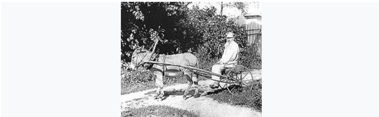
Рис. 17. А. Фет, объезжающий свои владения в Воробьёвке, на ослике по кличке «Некрасов» (1890)

В период с 1883 по 1891 гг. А. А. Фет написал более 300 стихотворений, которые вошли в сборник «Вечерние огни», 4-й выпуск которого издан при жизни, а 5-й вышел после его смерти.