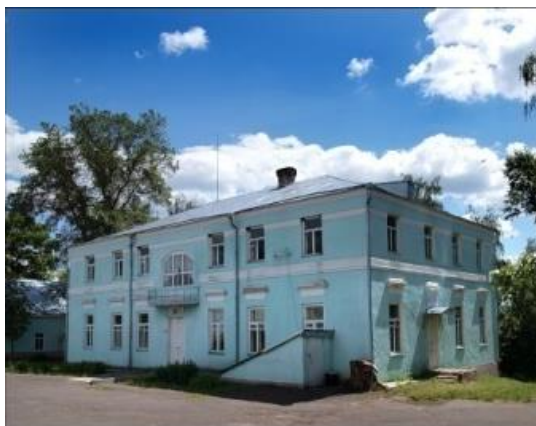
Рис. 18. Музей «Усадьба А. А. Фета».

экспозиция, рассказывающая о жизни и творчестве Фета. С 1986 г. в Воробьёвке проводятся Фетовские чтения (рис.18).