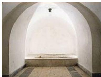
Рис. 20. Вид на склеп изнутри с могилами А. А. Фета и его супруги М. П. Фет.