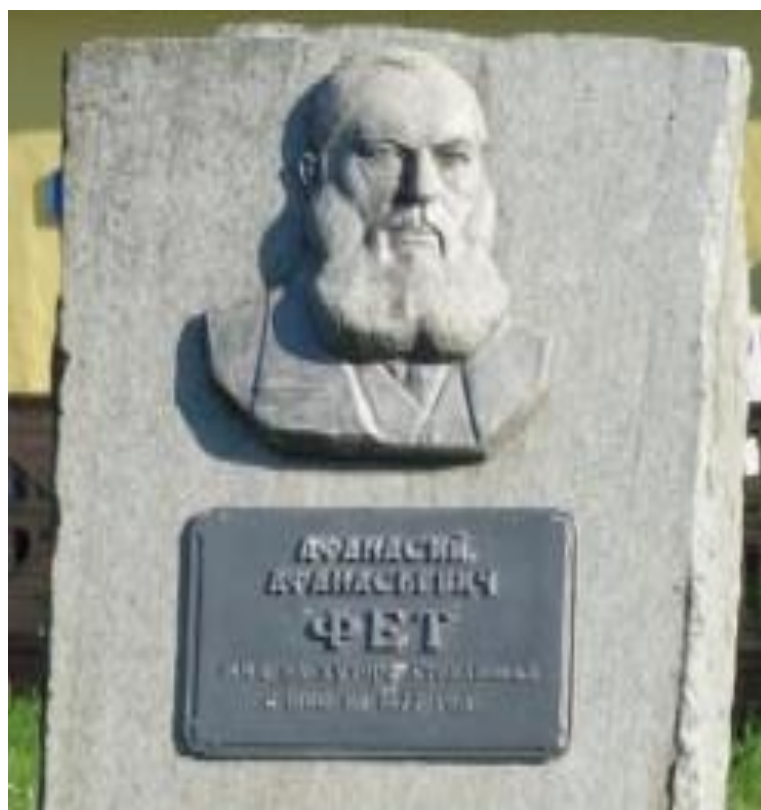
Рис. 24. Памятник А. А. Фету в г. Змиёвка Свердловского района Орловской области. Надпись гласит: «Афанасий Афанасьевич Фет Жил на хуторе Степановка с 1860 по 1877 год»