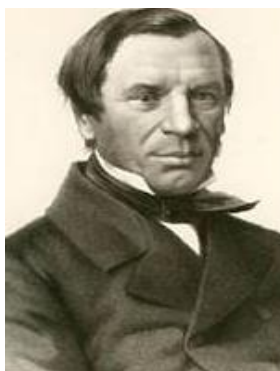
Рис. 8. М. П. Погодин (23.11.1800–20.12.1875) – историк, журналист и публицист, редактор журнала «Москвитянин».

В 1838 г. он поступил на юридический факультет Московского университета, затем перевёлся на историко-филологическое (словесное) отделение философского факультета, который окончил в 1844 г. Будучи на первом курсе, Афанасий по-прежнему пишет стихи, которыми заинтересовываются однокурсники. Показав их как-то М. П. Погодину, – который сочувственно относился к литературной деятельности Фета и подаривший ему билет на получение журнала «Москвитянин» с оригинальной надписью на обороте: «Талантливому сотруднику от журналиста; а студент берегись! пощады не будет, разве взыскание сугубое по мере талантов полученных», – а тот – писателю Н. В. Гоголю, юноша не заставил себя ждать, получив от Николая Васильевича ответ о несомненном даровании поэта, что привело его к дополнительному импульсу творческого вдохновения. Его произведения одобряли и друзья, в частности, поэт Аполлон Григорьев, к которому Фет переехал из дома М. П. Погодина и с которым в дальнейшем на всём протяжении учёбы в университете сложились самые тёплые, дружеские отношения: два поэта поддерживали друг друга в