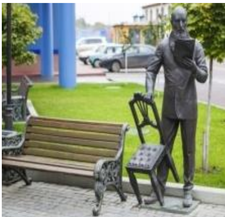
Рис. 26. Скульптура Афанасия Фета в Литературном сквере у ТМК «Гринн», г. Орёл.