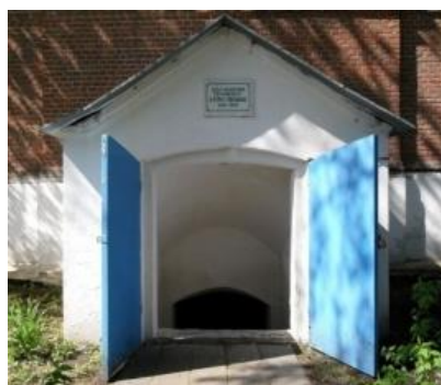
Рис. 19. Надпись над склепом, который находится под церковью Покрова Пресвятой Богородицы, гласит: «Здесь похоронен русский поэт А. А. Фет (Шеншин) 1820–1892»

А. А. Фет пожелал быть похороненным в склепе под церковью Покрова Пресвятой Богородицы в селе Клеймёново в Мценском уезде Орловской губернии, расположенной в 25 км от г.Орла, вместе с супругой Марией Петровной, которая пережила его всего на 2 года (рис.19–21).