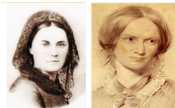
Рис. 5. Шарлотта-Елизавета (Шарлотта Карловна) Беккер (1798–1844)

Его рождению предшествовало много запутанных моментов. Мать: Шарлотта-Елизавета (Шарлота Карловна)-Беккер (рис. 5), родной отец – Иоганн-Петер-Карл-Вильгельм Фёт (Johann Peter Karl Wilhelm Föth), ассессор городского суда Дармштадта (рис. 6).