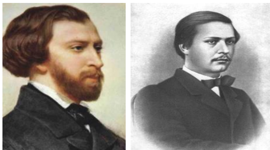
Рис. 7. Афанасий Фет в молодости

приехал в Москву, где продолжил обучение, но уже в пансионе профессора всеобщей истории М. П. Погодина с целью подготовки в Московский университет (рис.7, 8).