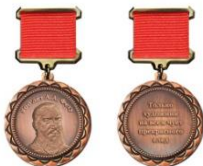
Рис. 3. Медаль «200 лет А.А.Фету»

А.А.Фет – признанный, как один из лучших лириков всех времён и народов. Следуя доброй традиции чтить имена самых достойных её представителей, к юбилею поэта Интернациональный Союз Писателей учредил медаль «200 лет А.А.Фету», которая будет вручаться авторам – участникам новой серии «Современникъ» (рис.3).