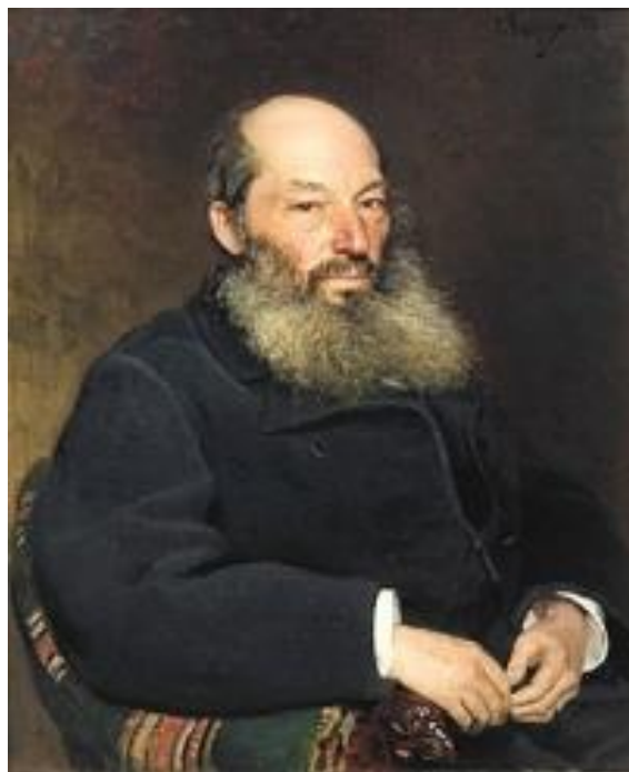
Рис.16. А. А. Фет. Портрет работы И. Е. Репина (1882).