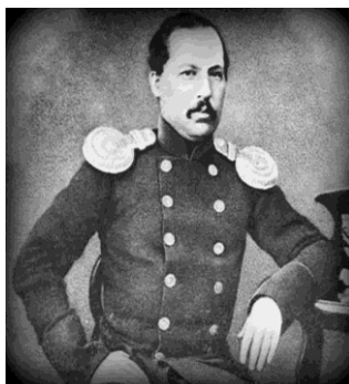
Рис. 11. Афанасий Фет во время военной службы в звании поручика

Кроме сочинения стихотворений А.А.Фет до самой старости занимался переводами. Афанасий Афанасьевич переводил на русский язык Гейне, Гёте, Мицкевича, Шенье, Шопенгауэра и других. Благодаря ему, почитатели его таланта знакомы с «Фаустом» Гёте, а за перевод сочинений Горация А. А. Фет стал первым лауреатом полной Пушкинской премии Императорской академии наук.