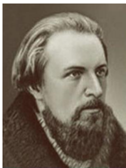
Рис. 9. А. А. Григорьев (28.07.1822–07.10.1864) – поэт, литературный и театральный критик.

творчестве и жизни. А. А. Григорьев даже в какой-то мере способствовал развитию поэтического дара А. А. Фета (рис. 9).