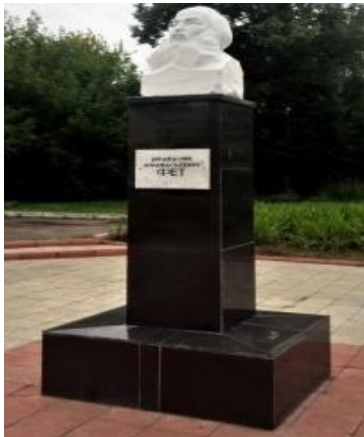
Рис. 22. Памятник А. А. Фету в г. Мценске.

В память о выдающемся поэте-лирике установлены памятники, скульптура, памятная стела, мемориальные доски в городах Мценске, Орле, Змиёвке и усадьбе Воробьёвке, а борт VP-BEO «Аэрофлота» модели Airbus A320-214 носит теперь имя А. А. Фета (рис.22–26).