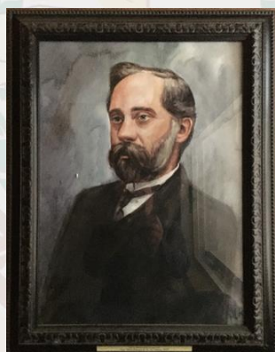
Пётр Иванович Карузин (1864–1939)

Худ. Мельникова О. К. 2019 г. Бумага, акварель.