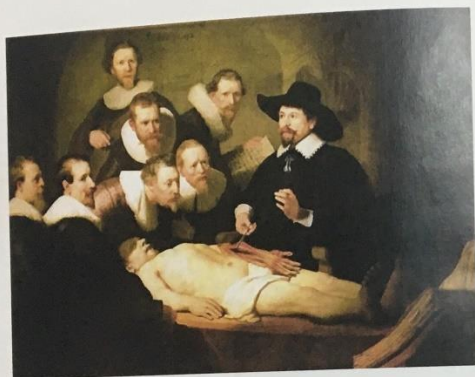
Рембрандт Харменс ван Рейн «Урок анатомии», 1632 год