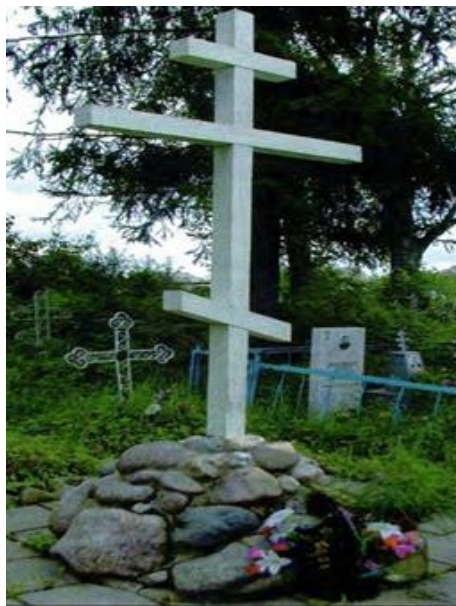
Рис. 6. Крест на братской могиле жертв расстрела. Фото 2003 года

много. В рапорте управляющего архиерея Евдокима (Мещерского) указывается, что расстрелянных «настолько изуродовали, что, по словам очевидцев, нельзя было узнать ни одного трупа. Расстрелянных мучеников почти нагих зарыли в одну яму без отпевания, и да и некому было отпевать: духовенство города Солигалича скрывается и его разыскивают». Расстрелянных похоронили в братской могиле на городском кладбище, у стен Петропавловской церкви рано утром 8 марта. На месте братской могилы были установлены крест и ограда, которые были снесены безбожниками в тридцатые годы. Крест на могиле был восстановлен в 1996 году (рис. 6).