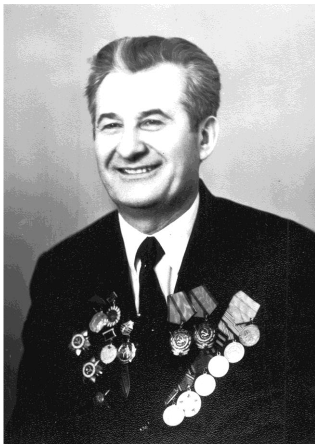
Дядя Стёпа - не только герой войны, но и труда, 70-е годы